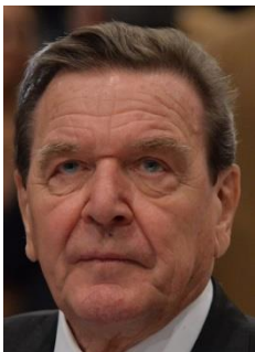
Gerhard Schröder 3)

Unterzeichnung des Maastricht-Vertrags, Vertrag über die Europäische Union (EU)