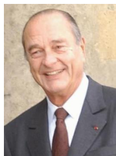
Jacques Chirac 4)