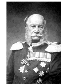
Kaiser Wilhelm I. 1)