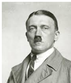
Adolf Hitler 2)