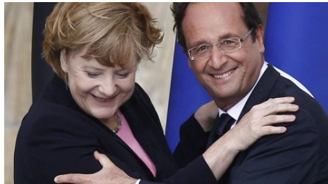
Angela Merkel und François Hollande 2)

Treffen Merkel-Sarkozy in Colombey-les-Deux-Églises in Erinnerung an Charles de Gaulle und Konrad Adenauer