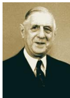
Charles de Gaulle