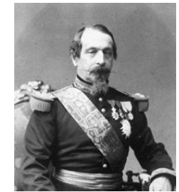
Kaiser Napoleon III. 2)