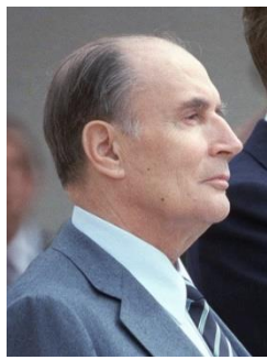
François Mitterrand 2)