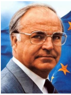
Helmut Kohl 1)