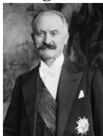
Albert Lebrun 3)

Der zweite Weltkrieg endete mit der Kapitulation Deutschlands am 08.05.1945 .