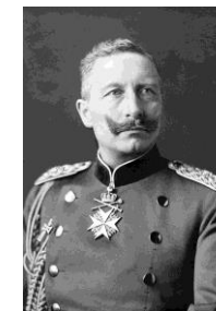
Kaiser Wilhelm II. 3)