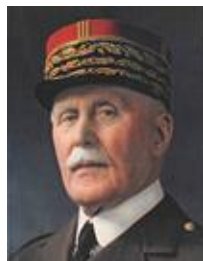
Philippe Pétain 4)

Der zweite Weltkrieg endete mit der Kapitulation Deutschlands am 08.05.1945 .