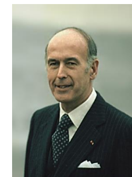
Valérie Giscard d'Estaing